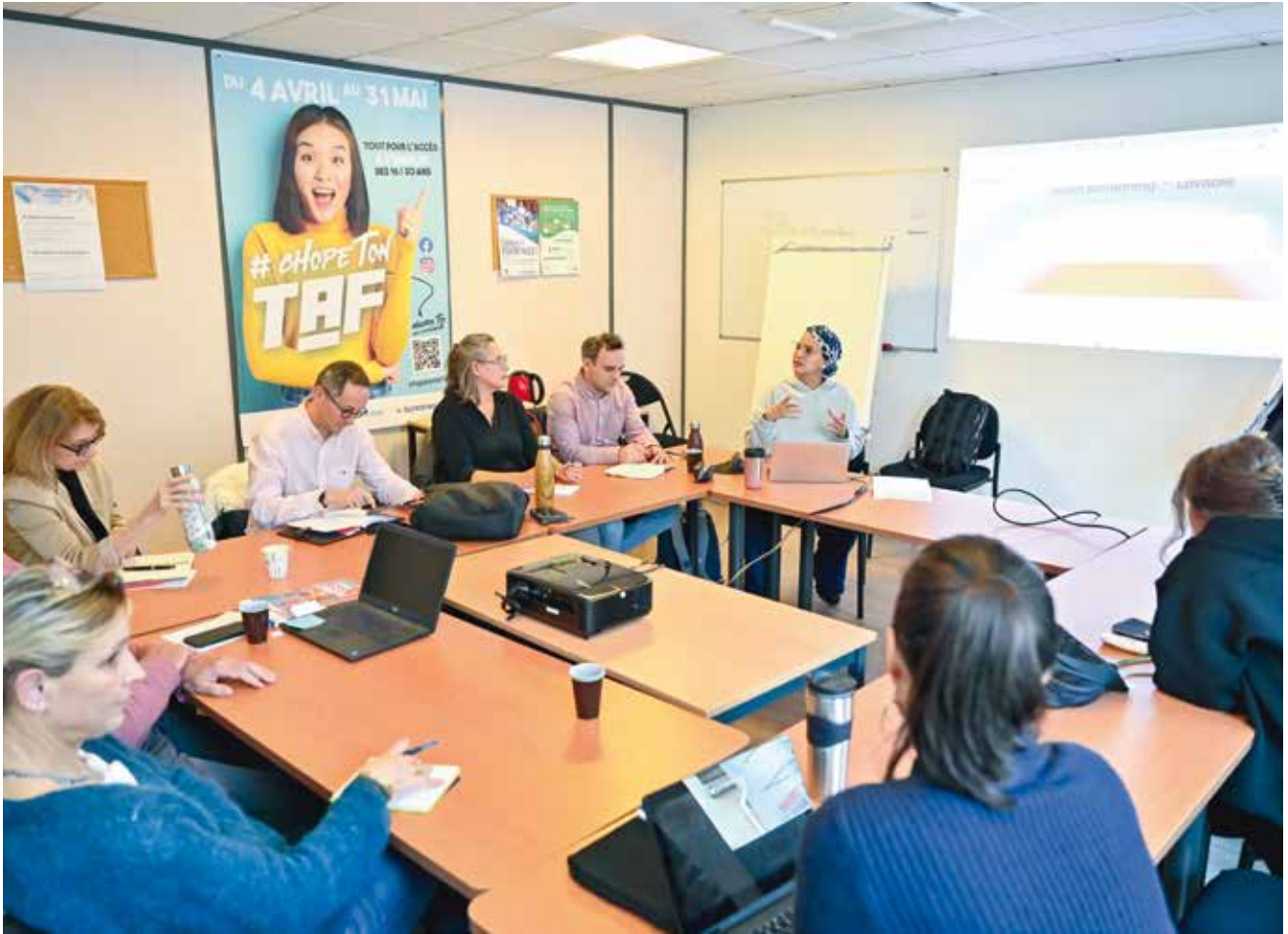
↑ Une dizaine d'entrepreneurs ont participé à l'atelier de l'IA au service du marketing digital, le 8 décembre dernier.