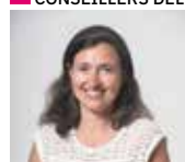
Sophie de Lamotte Lecture publique, Musique, Danse, Arts plastiques, Cinéma, Commande publique et Plan vélo