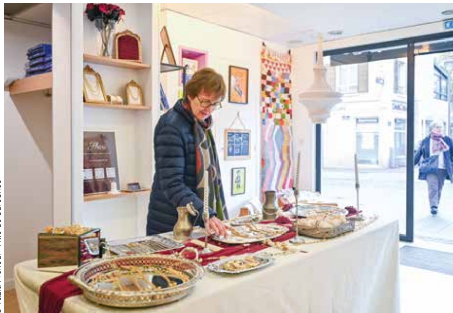
© Yazid Menour Ville de Suresnes