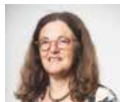
Florence de Septenville Seniors, Accompagnement social et Handicap