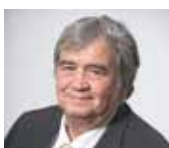
Louis-Michel Bonne Fêtes, Événementiel et protocole, Fêtes foraines, Vie des associations et Tourisme